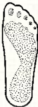
Nákres 2 - Obrys chodidla a otisk šlápoty ☺

Dále potřebujeme obrys Vašeho chodidla. Položte na rovnou podlahu čistý list papíru - většího než samo chodidlo. Posadte se na židli a položte pravé chodidlo (buď v ponožce či punčochách - dle sezónnosti obuvi) na papír tak, aby stálo v pravém úhlu k listu. Pro nejpřesnější pořízení obrysu obkreslujte chodidlo buď samotnou tenkou náplní z propisky či tužky. Dbejte na to, aby se náplň či tuha dotýkala nohy a byla stále pod pravým úhlem k listu papíru. Doporučujeme začít od paty a vést linii k palci po vnitřním obvodu, poté linii od paty k palci po vnějším obvodu. Výsledkem je obrys pravé nohy, viz nákres 2.